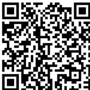
QR Code รายงานนวัตกรรมการพัฒนาคุณภาพการศึกษาฯ

๑๖. จัดการอบรมเชิงปฏิบัติการแลกเปลี่ยนเรียนรู้ ขยายผลนวัตกรรมการศึกษาเพื่อพัฒนาการศึกษาระดับจังหวัด ตามโครงการ Innovation For Thai Education (IFTE) นวัตกรรมการศึกษา เพื่อพัฒนาการศึกษา ประจำปีงบประมาณ พ.ศ. ๒๕๖๕ ในวันอาทิตย์ที่ ๑๑ กันยายน ๒๕๖๕ ผ่านสื่ออิเล็กทรอนิกส์ออนไลน์ ด้วยการประชุมทางวิดีโอ ZOOM โดยถ่ายทอดสดจากห้องประชุมมนตรี สำนักงานศึกษาธิการจังหวัดพิษณุโลก