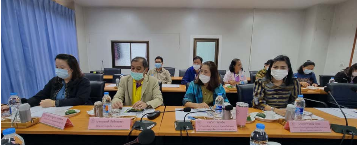
ประชุมเชิงปฏิบัติการทบทวนและจัดทำร่างยุทธศาสตร์ แนวทางการพัฒนาการศึกษา แผนพัฒนาการศึกษาจังหวัดพิษณุโลก พ.ศ. ๒๕๖๖ - ๒๕๗๐ วันที่ ๑๖ ธันวาคม ๒๕๖๖