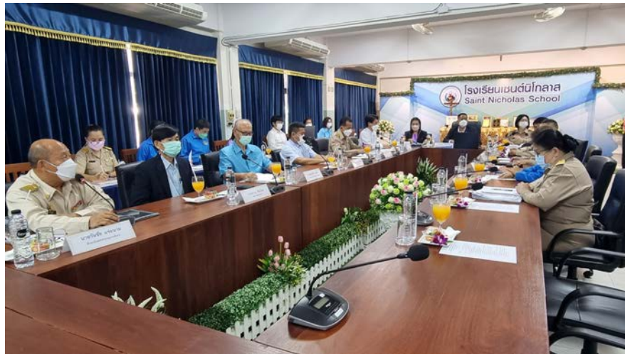
ตรวจราชการโรงเรียนเซนต์นิโกลาส สังกัด สช.