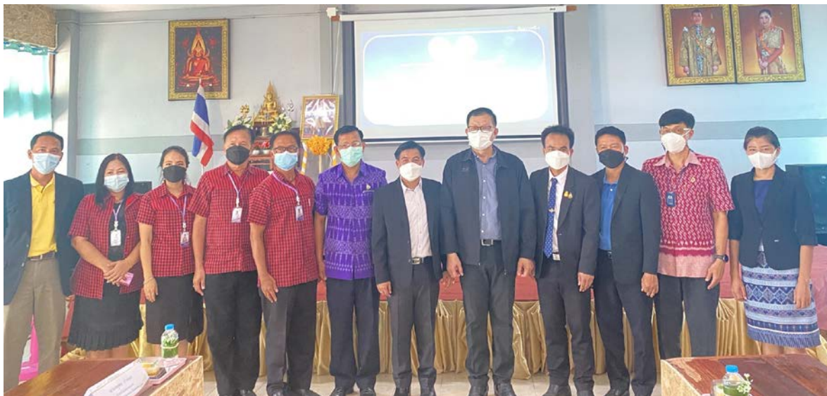
ตรวจราชการ โรงเรียนวัดบ่อภาค สพ.พล.๓