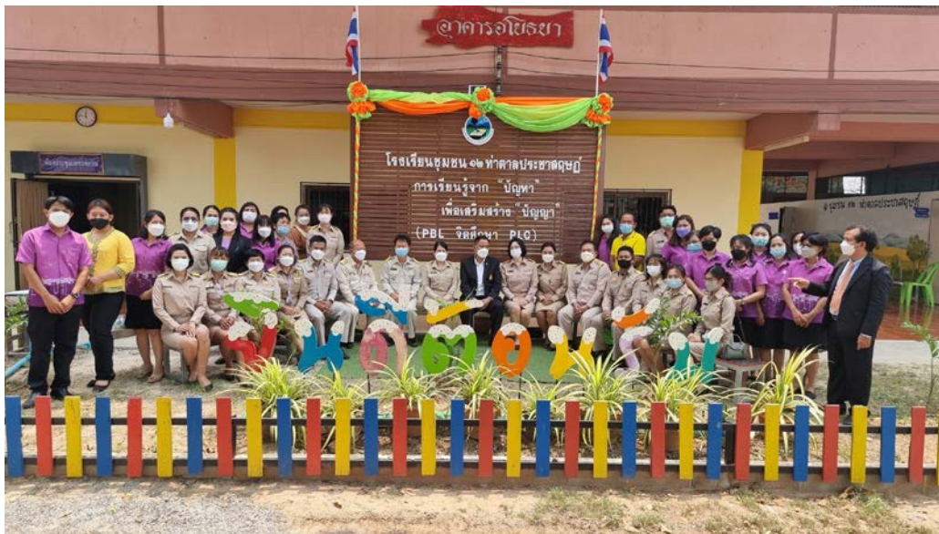
ตรวจราชการโรงเรียนชุมชน ๑๒ ท่าตาลประชาศฤกษ์ สพป.พล.๒