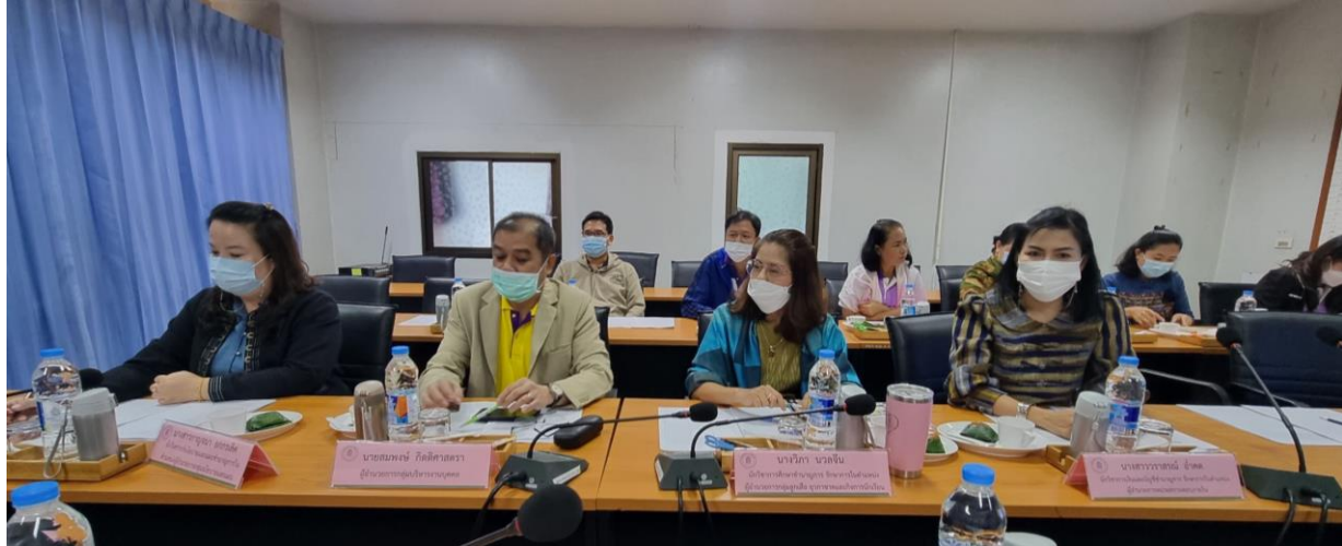
ประชุมเชิงปฏิบัติการทบทวนและจัดทำร่างยุทธศาสตร์ แนวทางการพัฒนาการศึกษา แผนพัฒนาการศึกษาจังหวัดพิษณุโลก พ.ศ. ๒๕๖๖ - ๒๕๗๐ วันที่ ๑๖ ธันวาคม ๒๕๖๖