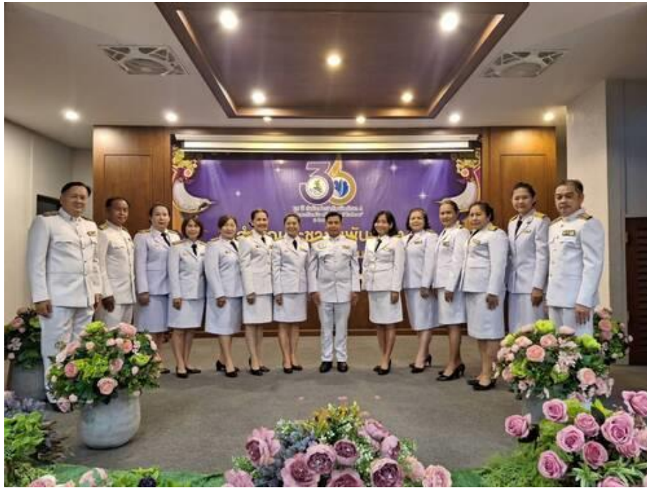
กิจกรรมเดินถือพานดอกบัวถวายพระพุทธชินราช ๖๖๖ ปี วันที่ ๖ มิถุนายน ๒๕๖๖