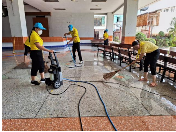
ภาพก่อนทำ (Before)